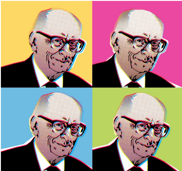
Grafik: Wiesław Smetek, Flyer: koenige.org